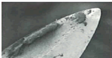
UTILISÉE UNE SEULE FOIS