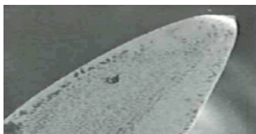
UTILISÉE QUATRE FOIS