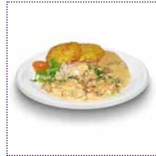
Zürcher Geschnetzeltes mit Rösti*