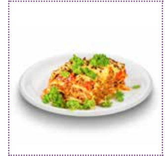
1 Teller Lasagne Bolognese (ca. 470g)