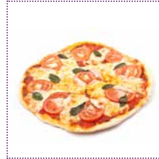
Pizza Margherita (ca. 420g)