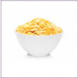
1 Schale Cornflakes mit 2dl Milch (ca. 240g)