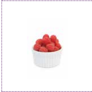
1 Schale Himbeeren (ca. 80g)