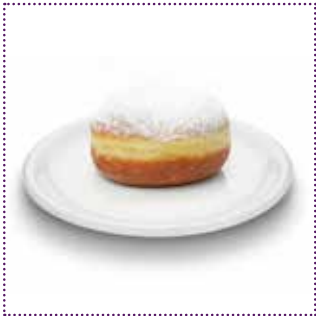
1 Berliner (ca. 60g)